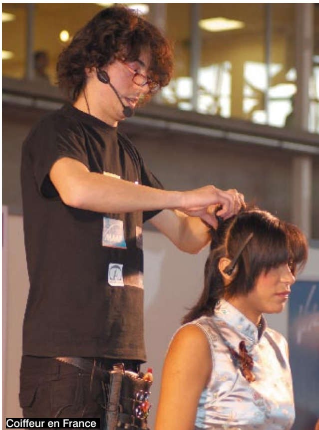
Coiffeur en France