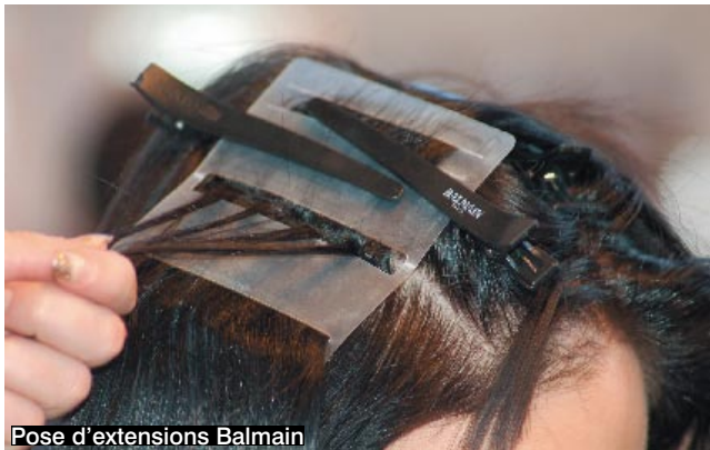
Pose d'extensions Balmain