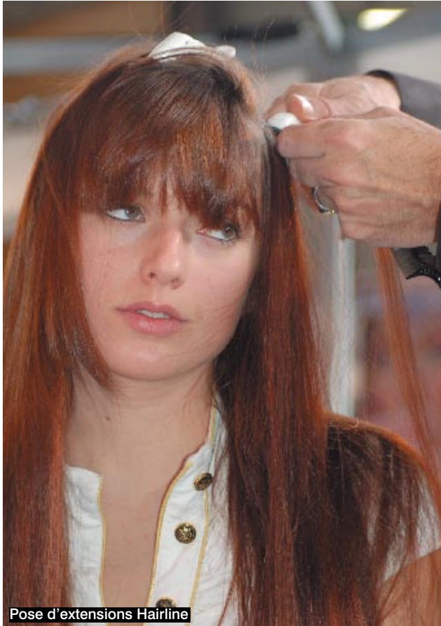
Pose d'extensions Hairline