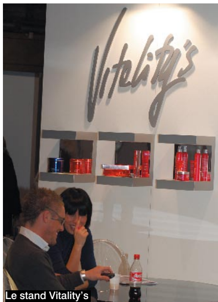
Le stand Vitality's