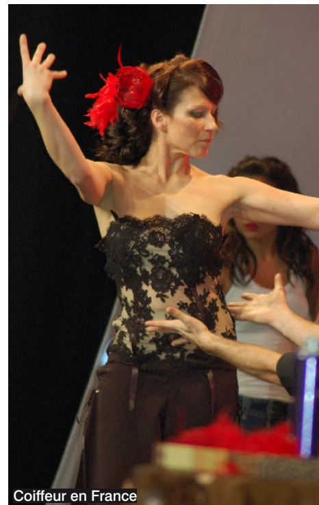
Coiffeur en France